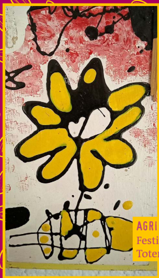
AGRIKUNST auf dem Festival von Francisco Totem Perez (Berlin).